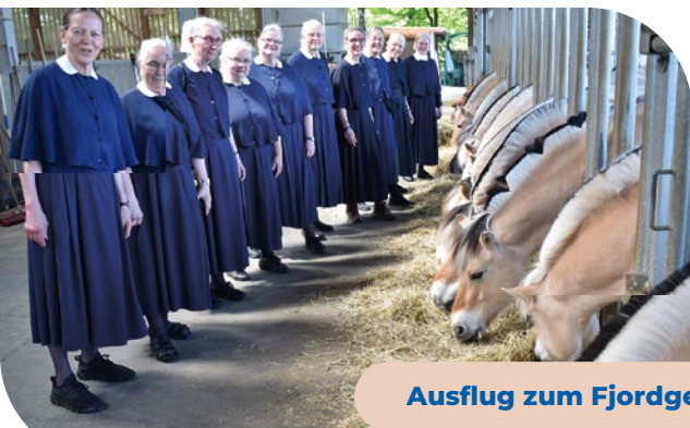
Ausflug zum Fjordgestüt