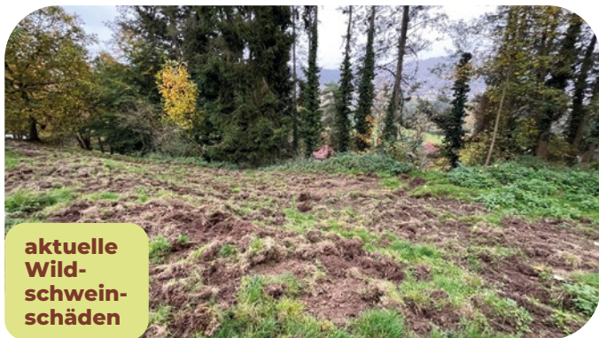
aktuelle Wild- schwein- schäden

In unseren Außenanlagen macht uns eine regelrechte Wildschwein-Plage ratlos. Regelmäßig kommen die Wildschweine nachts aus dem nahegelegenen Wald und verwüsten die Grünflächen. Das komplette Gelände ist eingezäunt, der Zaun teilweise im Boden verankert und mit Elektrozäunen verstärkt. Dennoch finden die Tiere irgendwie immer wieder einen Zugang. Die zuständigen Jäger nehmen das Problem zwar ernst, haben jedoch nur begrenzte Möglichkeiten aufgrund der Nähe zum Wohngebiet.